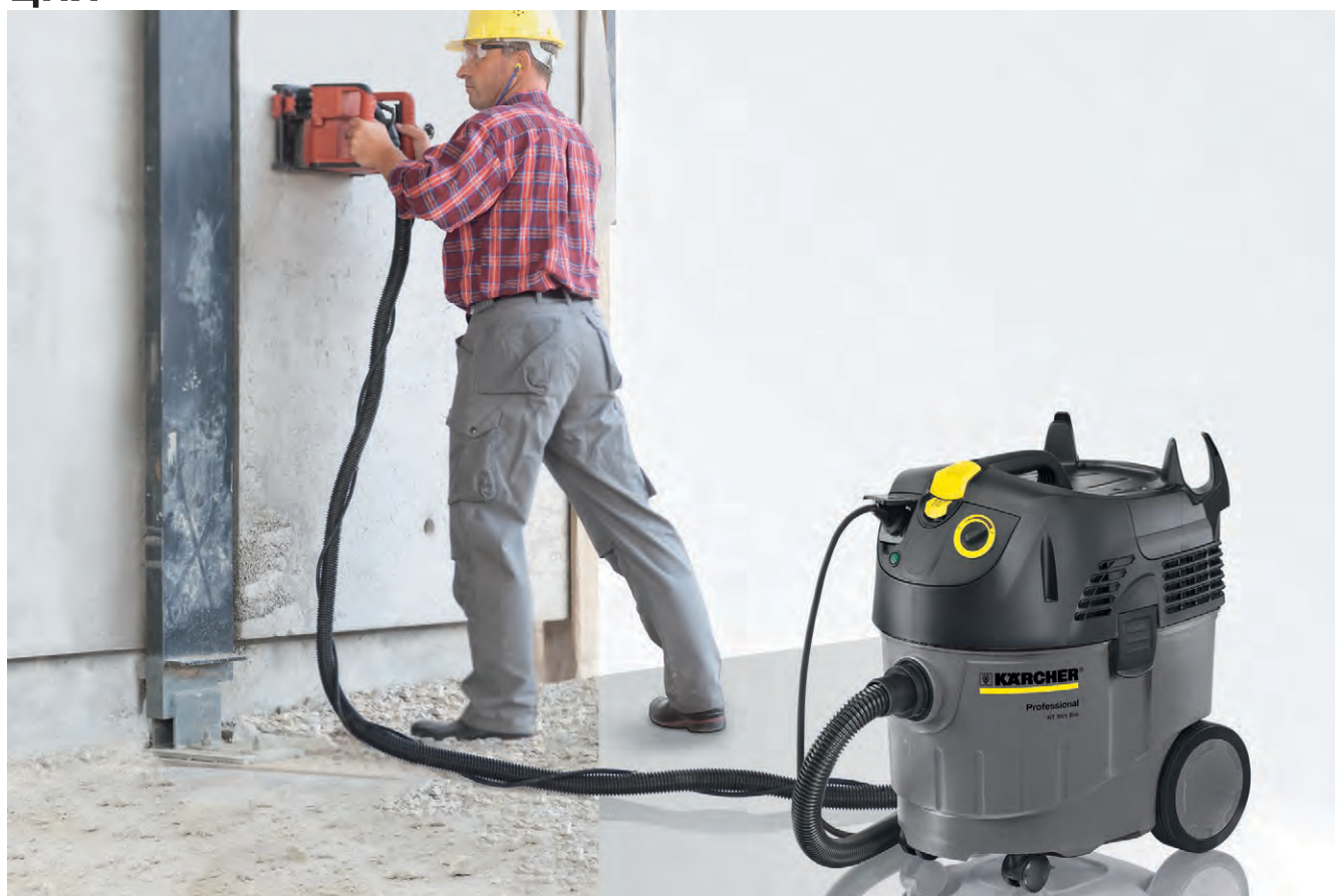
NT 35/1 Tact Bs