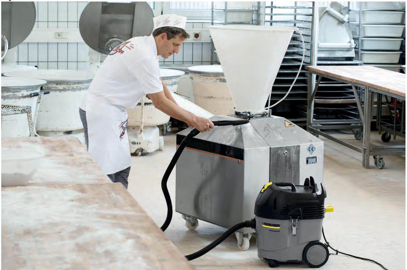
NT 35/1 Tact *EU

■ Держатели для принадлежностей / всасывающего шланга