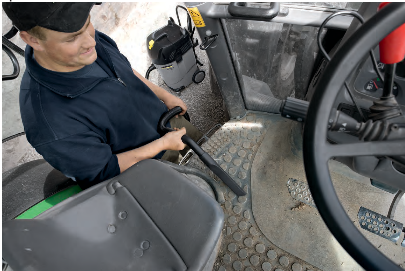
NT 55/1 Tact Bs