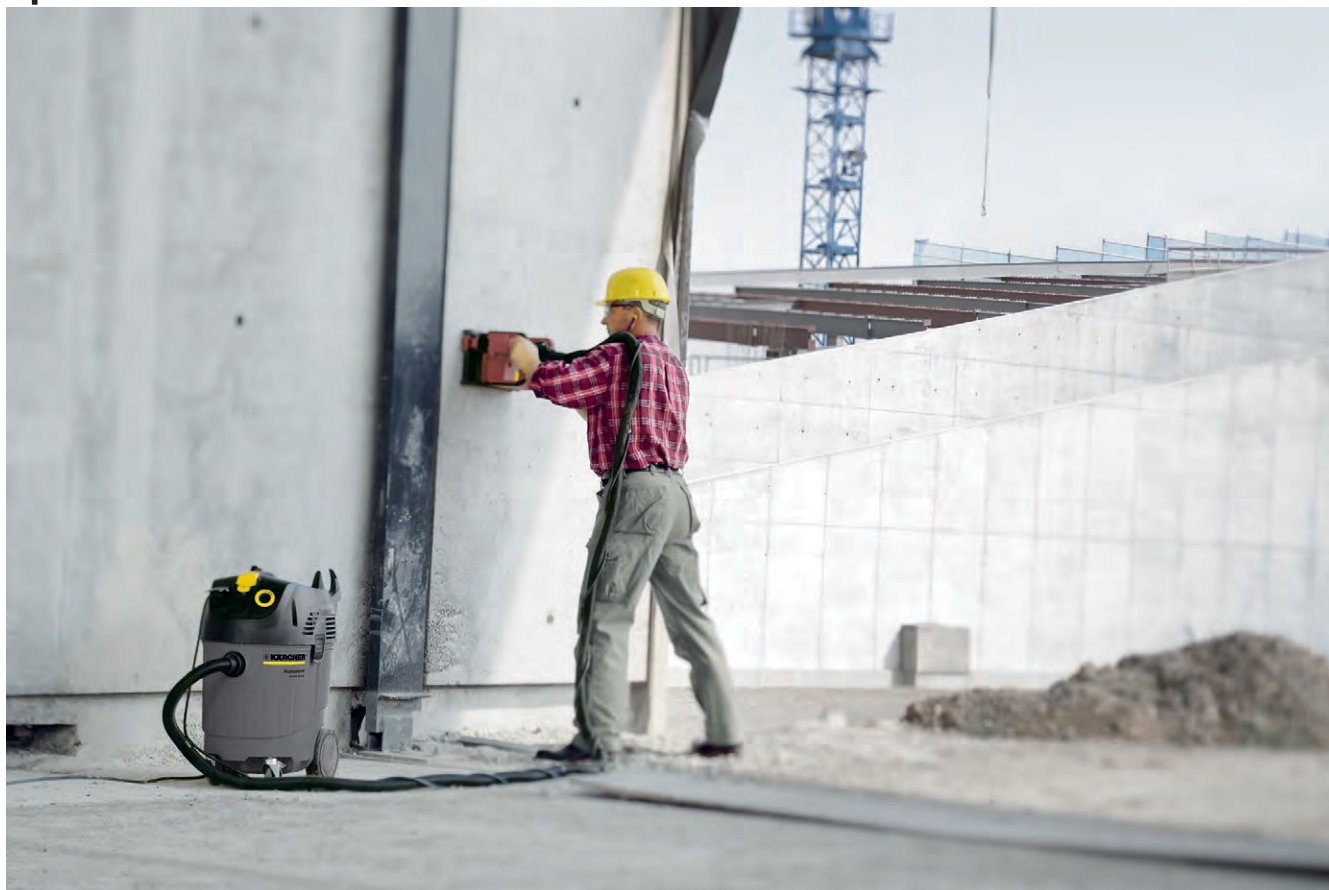
NT 45/1 Tact

■ Держатели для принадлежностей / всасывающего шланга