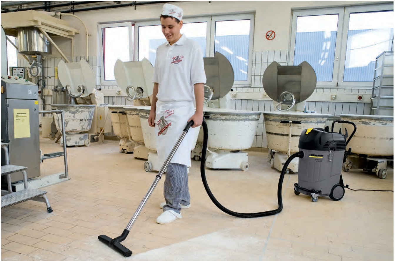
NT 55/1 Tact Te