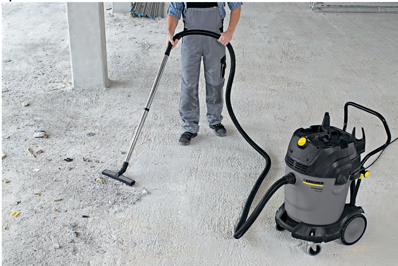
NT 65/2 Tact 2