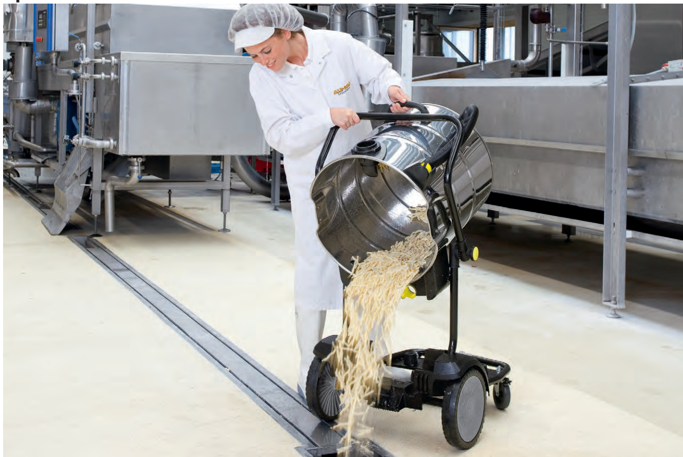
NT 75/2 Tact 2 Me Tc *EU