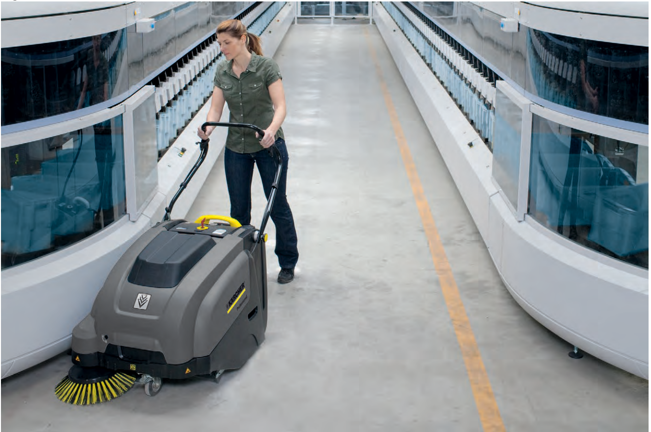
KM 75/40 W P