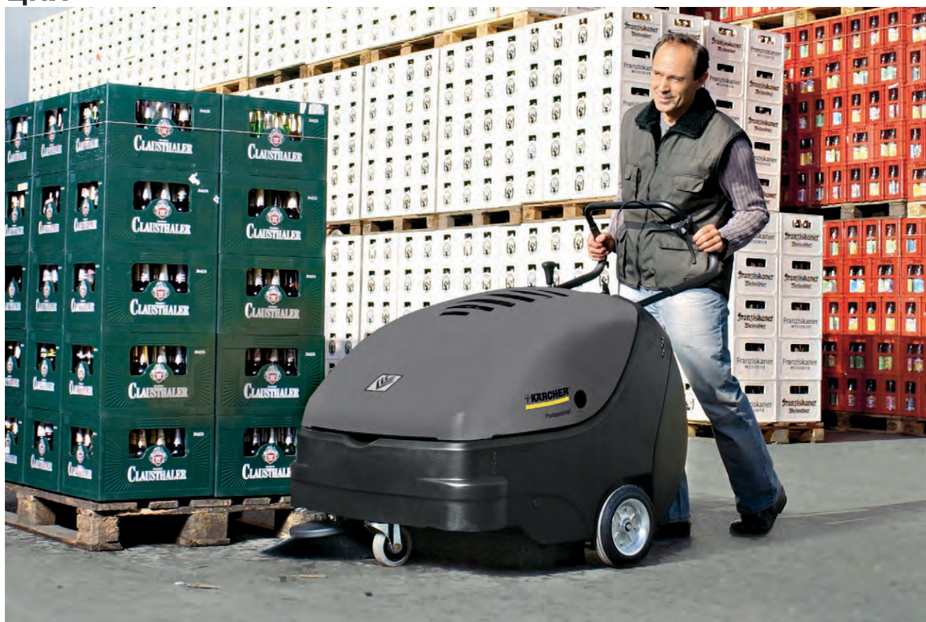
KM 85/50 W P