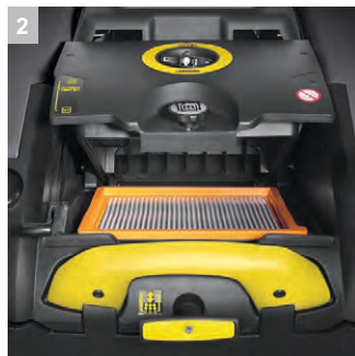
2 Эффективная система очистки фильтра с механическим управлением