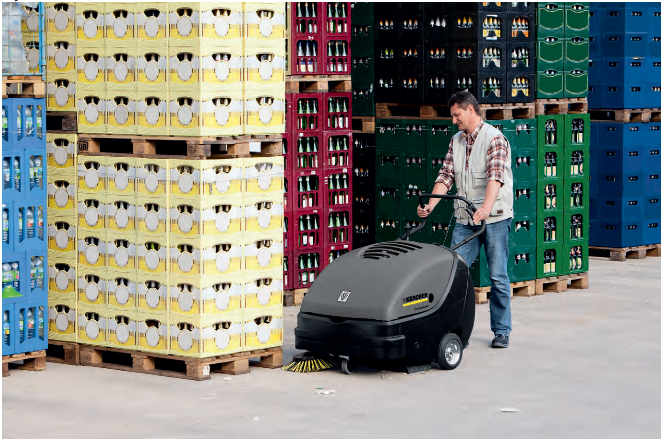
KM 85/50 W Bp Adv