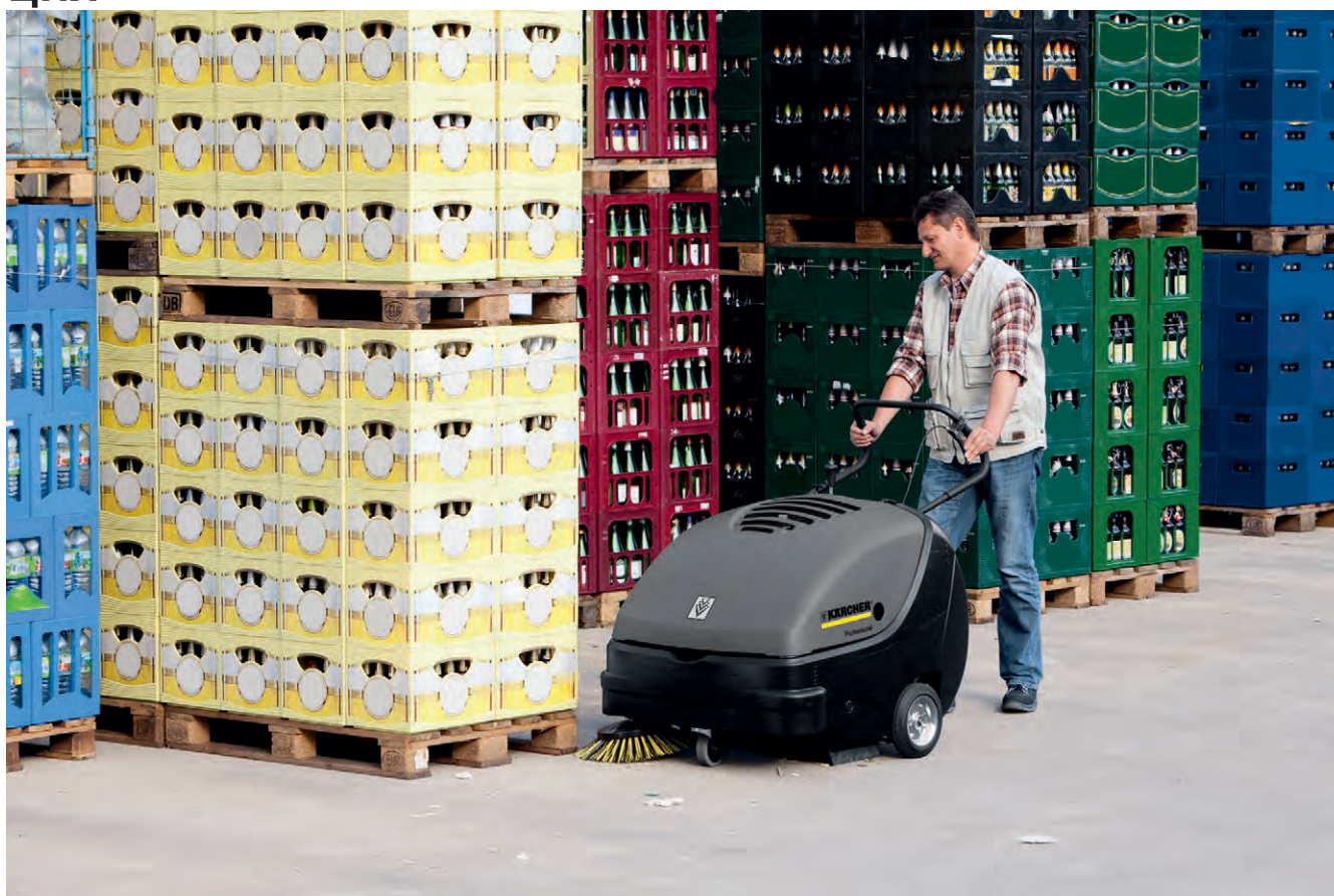
KM 85/50 W Vp