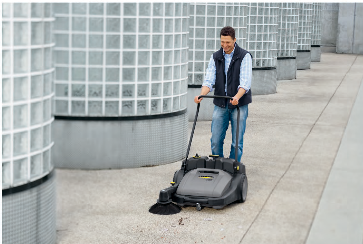
КМ 70/30 С Вр

■ Электропривод цилиндрической и боковой щеток