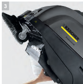
3 Простота обслуживания