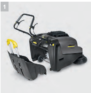
1 Контейнер для мусора

"Что может быть легче, чем подметать" Ручная подметальная машина с питанием от батареи и электронноуправляемой подзарядкой. Отсутствие выхлопных газов, низкий уровень шума, используется для тщательной, без пыли очистки площадей от 600 кв.м., идеально подходит для использования внутри помещения. Подходит для чистки ковров с дополнительным комплектом для чистки ковров. Проста в использовании благодаря концепции управления EASY и мобильному контейнеру для мусора с троллейной системой. Компактные размеры для легкого маневрирования.