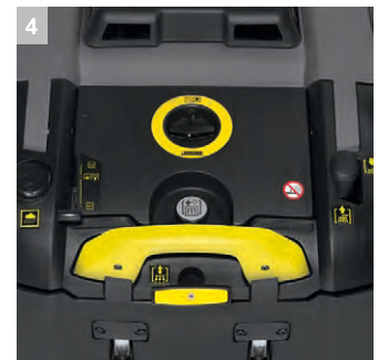
4 Концепция EASY Operation